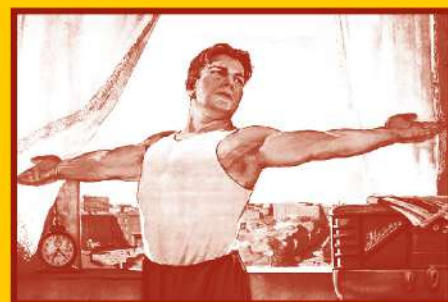
Ведите здоровый образ жизни