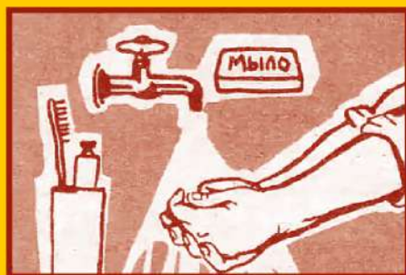
Регулярно мойте руки