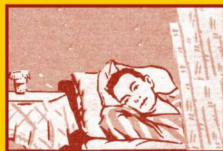
Избегайте контактов с заболевшими