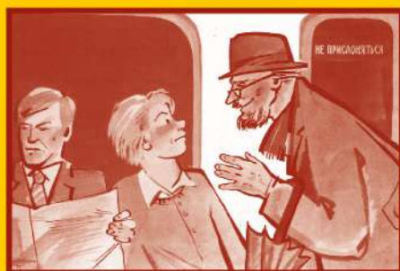
Ограничьте пребывание в местах скопления людей